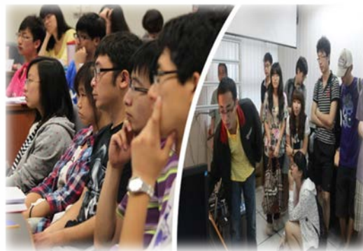
学习访问：创新内容，过程精彩无限