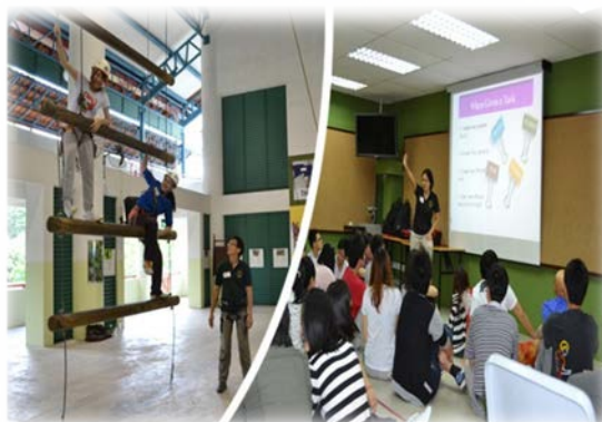
拓展合作：多层挑战，勇于突破自我