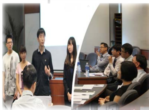
比赛实践：实战演练，积累宝贵经验